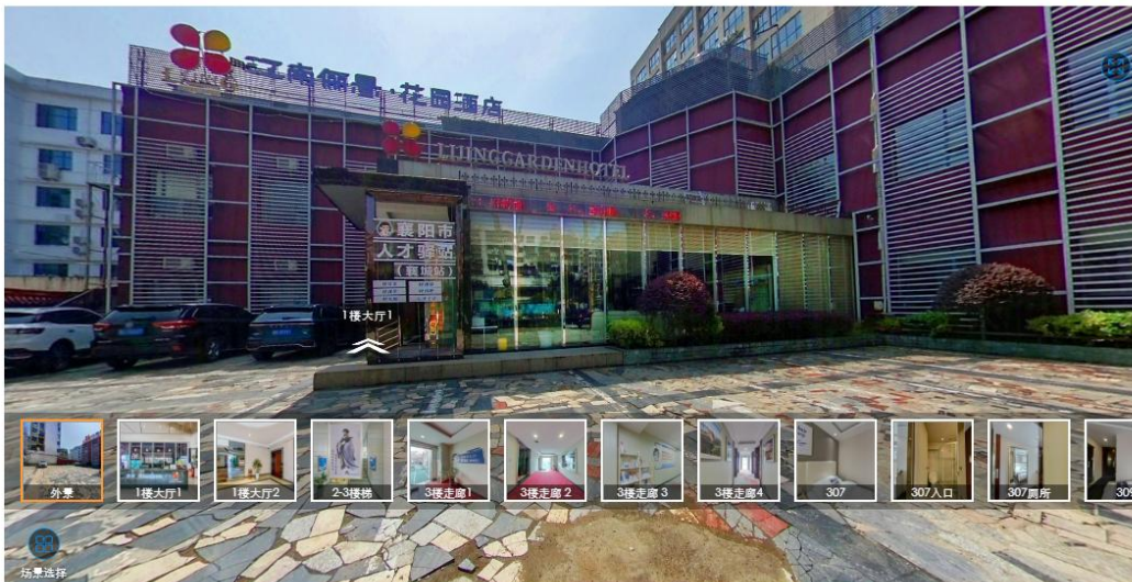
人才驿站展示界面