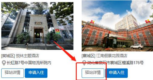
人才驿站列表界面