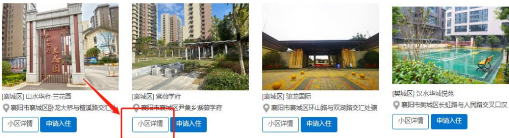
人才公寓列表界面