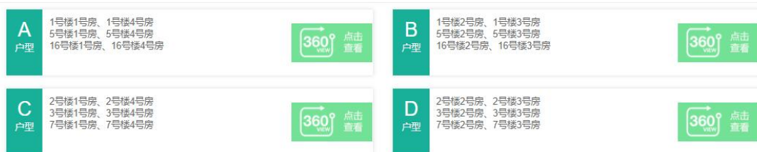
人才公寓展示界面